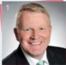
1 Brato, Bernd (57) Bürgermeister, Betzdorf